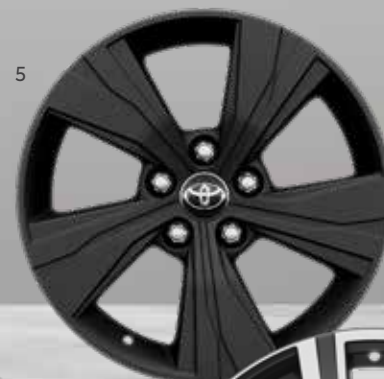
5. 17 colių 5 stipinų matiniai juodi lengvojo lydinio ratlankiai