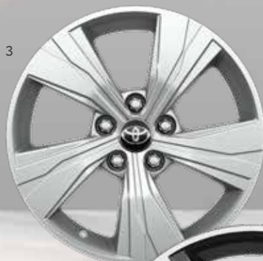
3. 17 colių 5 stipinų sidabriniai lengvojo lydinio ratlankiai

Standartinė Active Plus, Luxury ir Luxury Plus modelių komplektacija