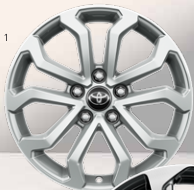
1. 17 colių 5 dvigubų stipinų sidabriniai lengvojo lydinio ratlankiai

Standartinė Active modelių komplektacija