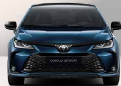
Corolla sedano kėbulo spalvų variantai

Corolla sedano kėbulo spalvų paletę sudaro įvairūs vienspalviai ir dvispalviai variantai. Į ją įtraukti nauji Midnight Teal ir Ash Grey atspalviai, įkvėpti naujausių dizaino, mados ir architektūros tendencijų.